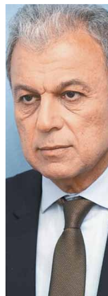
► Με την «ψήφο εμπιστοσύνης» του νέου περιφερειάρχη Γιώργου Αμανατίδη και την υποστήριξη της ΑΝΚΟ έχουν δημιουργηθεί οι κατάλληλες προϋποθέσεις για την ενίσχυση της επιχειρηματικότητας

Με την εκτιμώμενη δημιουργία 10.000 νέων θέσεων εργασίας μέχρι το 2030, η Δυτική Μακεδονία εδραϊώνεται ως το ιδανικό σημείο για μεγάλες και μικρές επιχειρηματικές επενδύσεις, διαμορφώνοντας το μέλλον της επιχειρηματικότητας και της καινοτομίας στην ευρύτερη περιοχή της Νοτιοανατολικής Ευρώπης.